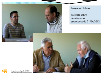
Proyecto Dehesa. Pretests sobre cuestionario estandarizado 21/04/2013